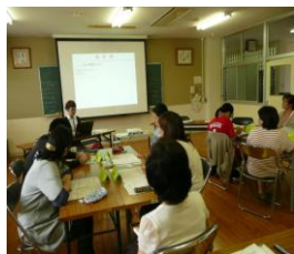
【地震災害への避難訓練】